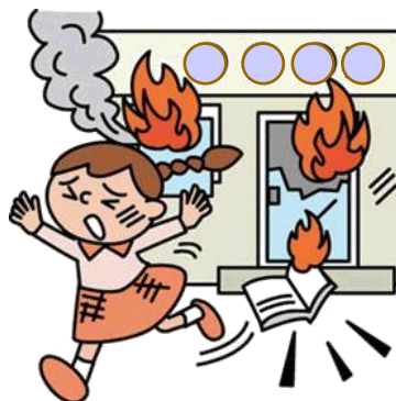
火花が原因で火災