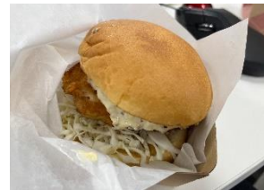
あんこうのフィッシュバーガー