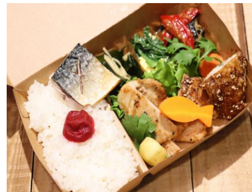
女川産のギンザケ塩焼き