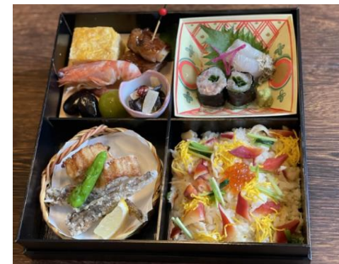
常磐もの穴子けんちん揚げ