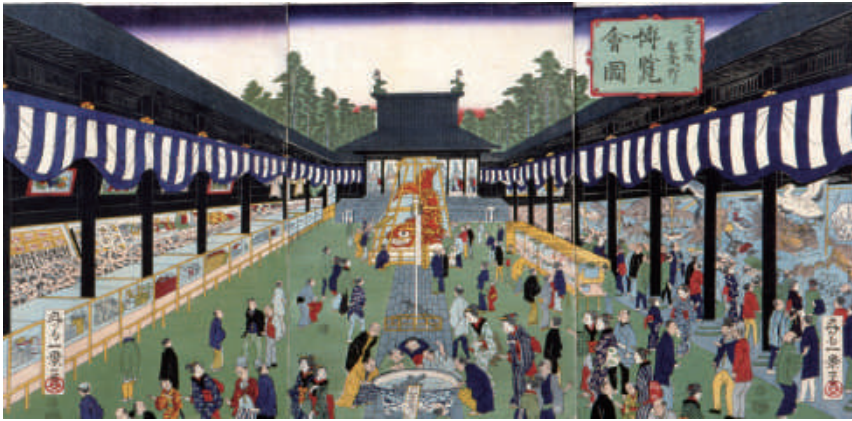
「元ト昌平阪聖堂ニ於テ 博覧会図」

会場：大阪くらしの今昔館 大阪市北区天神橋6丁目4-20 住まい情報センタービル8階 企画展示室