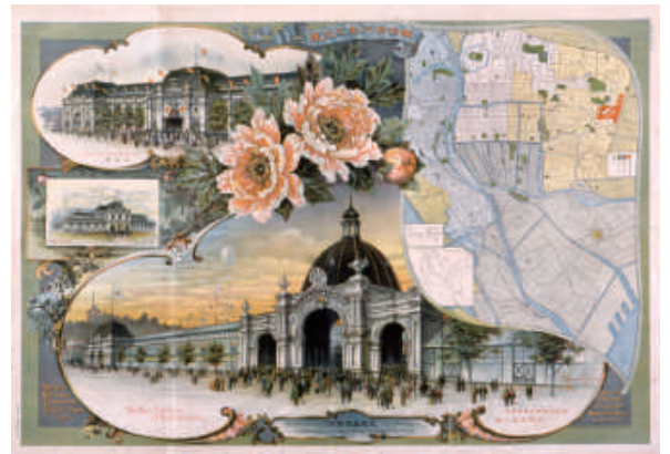
第5回内国勸業博覧会「明治三六年之大阪」(大阪毎日新聞社発行・株式会社乃村工藝社 蔵)

本展では19世紀から20世紀の博覧会を俯瞰し、時代とともに変わってきた人々の価値観や他者へのまなざしを読み解くとともに、大阪を会場とした博覧会に焦点を当て、大阪の人々の生活スタイルや娯楽、都市文化を紹介します。