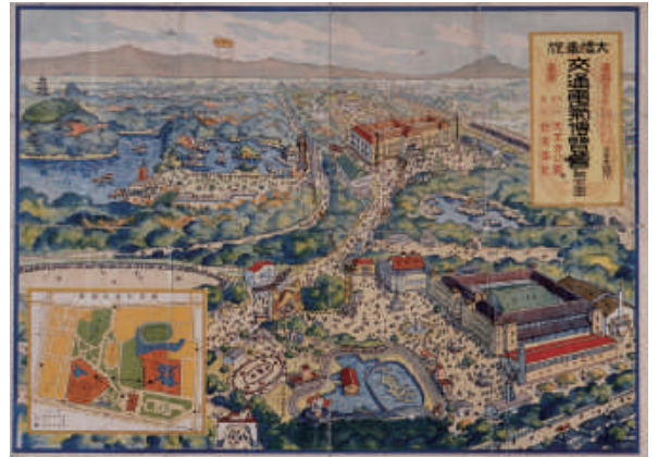
「大札奉祝交通電氣博覧会鳥瞰図」

博覧会の歴史は1851年のロンドン万博に遡り、その後、欧米各国で開催されるようになります。世界中の国々で、今日に至るまで実に数千回にも及ぶ博覧会が開催され、日本においても明治以降、多種多様な博覧会が開催されてきました。時代とともに博覧会の内容や展示手法は進化し、開催目的や性格も大きく変わっていきました。博覧会はその時代における社会的な要求や世相を映す鏡であったといえます。