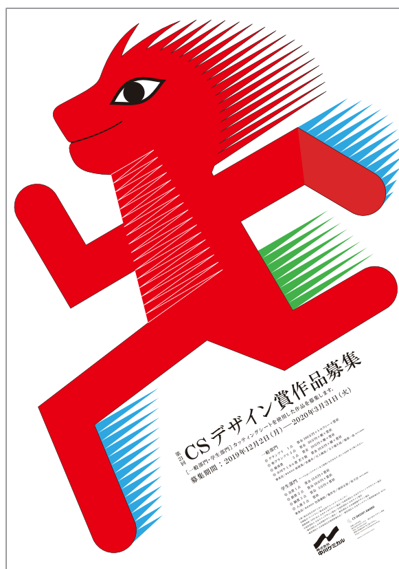
第21回CSデザイン賞作品募集ポスター デザイン：永井一正

お問い合わせ先 株式会社 中川ケミカル 第21回CSデザイン賞係 〒103-0004 東京都中央区東日本橋 2-1-6 岩田屋ビル 3F tel:03-5835-0347 fax:03-5835-0377 mail:info@cs-designaward.jp