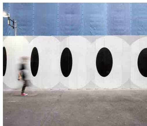
「グルグル」 シャ ショウコン / 多摩美術大学 環境デザイン