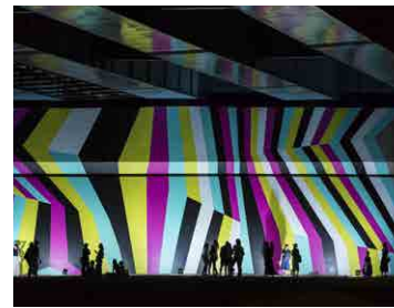
「Beautiful Bridge #2」 デザイナー／ラング & パウマン 他